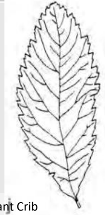
Extrait Plant Crib